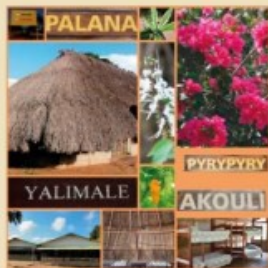
Plage de Yalimapo

Gîte YALIMALE Hébergement touristique, restauration sur réservation uniquement 05 94 34 71 05 / 06 94 44 95 00